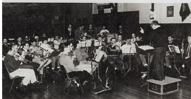
De oud-Limburgse Jagers repeteren weer.