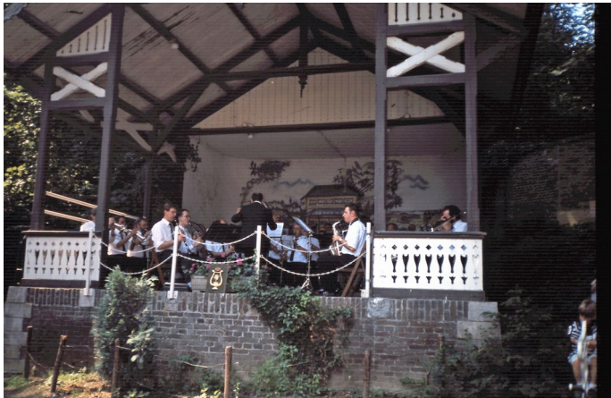
Het eerste concert vond plaats op het buitengoed van Slavante in Maastricht op 6 juni 1993

In het begin repeteerde het ROLJ eenmaal per maand, maar dat werd opgeschroefd naar eenmaal in de twee weken, omdat er meer optredens kwamen.