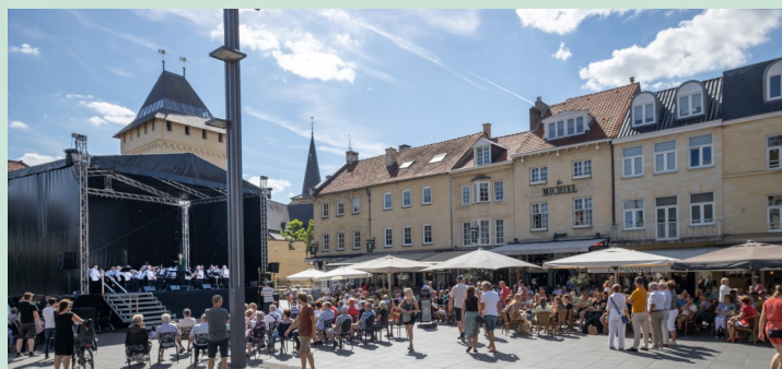
Middagconcert op zaterdag 16 juli in Valkenburg

In deze Nieuwsbrief leest u mooie reacties van deze drie concerten.