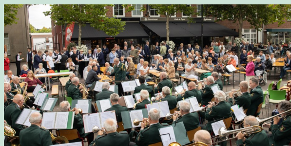
Kuurconcert op zondag 10 juli in Velden