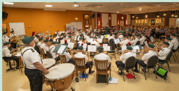
Concert op zondag 19 juni 2022 in Pey

De afgelopen 2 maanden gaf het ROLJ 3 geweldige concerten.