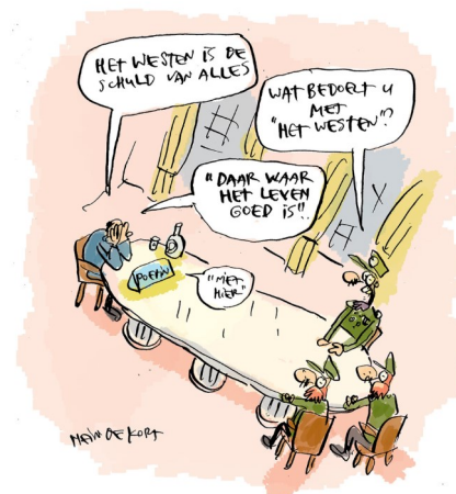
Poetin blijft 'het Westen' schuld geven van alles